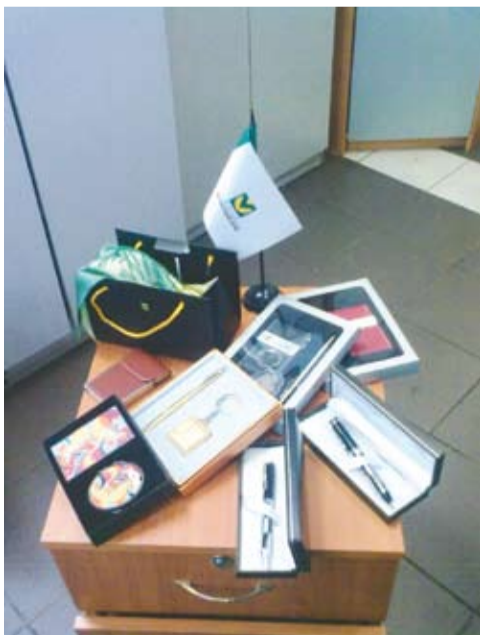
Призовой фонд викторины «Монетный двор»

«Жемчужина Монте-Кристо», где описывается период становления советской власти на Дальнем Востоке, и куда бежали дворяне и элита царской России, читаем: «Большинство, - пишет автор, - собирались как-нибудь удрать за границу или возвратиться в Москву, Петроград. У таких «туристов» сохранилось немало золотых импералов, платиновых пятёрок с изображением последнего русского императора». Далее в повести описываются методы, которыми пользовались для пересылки ценностей: «В переплётках книг укрывались золотые монеты. Вместо пуговиц к салопу пришивались обёрнутые в сукно платиновые пятёрки».